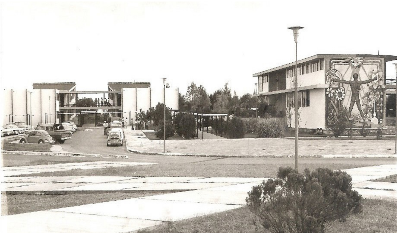
Universidad de Tamaulipas, primeros edificios del centro universitario Adolfo López Mateos, campus Victoria.